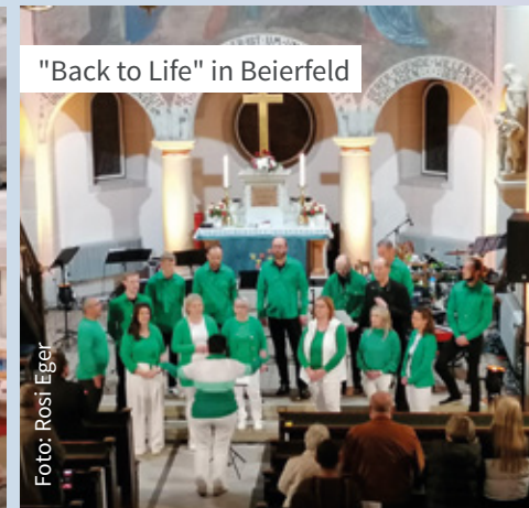
"Back to Life" in Beierfeld